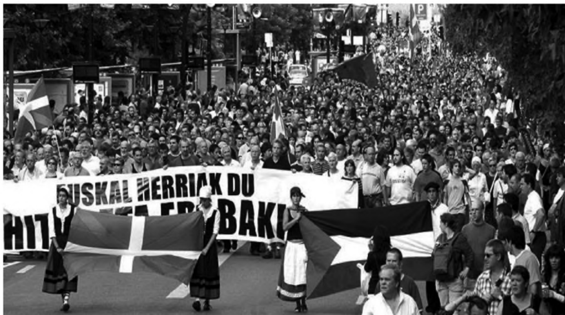
Manifestación en el País Vasco