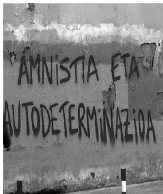
Pintada en favor de la autodeterminación

Esa comisión advirtió a Suárez el 10 de mayo de que si para el día 24 no se cumplían las condiciones de amnistía y libertades democráticas «habrá partidos que iniciarán una campaña a favor de la abstención, los alcaldes dimitirán de sus cargos y ETA comenzará a realizar actividades armadas». Suárez confesó que estaba en una situación precaria, que «en su equipo de fútbol hay cinco jugadores que están con el contrario». 78 No podía arriesgarse a provocar aún más al Ejército, sumamente irritado tras la reciente legalización del PCE, por lo que no otorgaría una amnistía general hasta después de las elecciones. Mientras tanto, se podía plantear hacer algunas extradiciones. Respecto a las libertades democráticas, «que se haga uso de